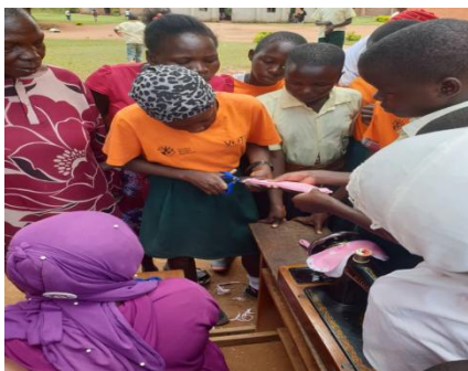
Butende Umea 初等学校の生徒がプロモーションセンターで学んだ知識を元に同級生をトレーニングしている。

Happy-Pad プロモーションセンターでは、多くの女性たちが布ナプキンの作製に興味を持って来ており、のべ 31 人をトレーニングし、370 枚のナプキンを生産することができた。7 月中は販売を行わなかった。また、Butende Umea 初等学校の生徒たちは学んだ知識を学校の同級生に広めることでより大きな影響を生み出していた。