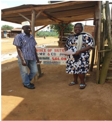
トークショーに参加した Votu メンバー