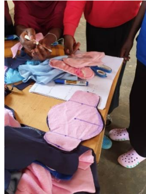
生地のプロ寸方法や断裁方法を学んでいる。