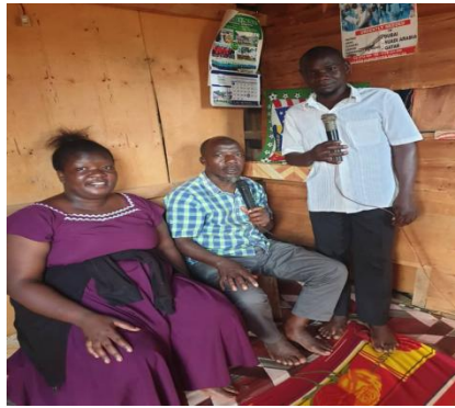
ラジオトークショーを行うブタンバラ県チーム