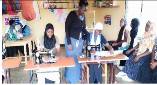
教員が作成中の布ナプキンを点検している。