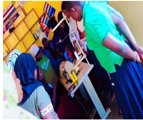
オーバーロックミシンの使い方を学んでいる。