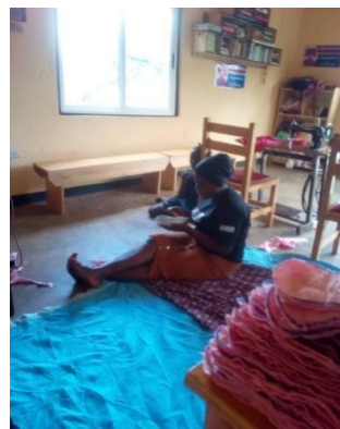
教員が生徒にナプキンの形成方法を教えている。