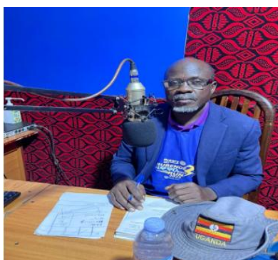
Tiger FM でラジオトークショーを行う SORAK 代表

ワキソ県では10月29日19時～20時にTiger FMより1時間のトークショーを実施した。SORAK代表は事業の概要やこれまでの成果を伝えた後に、布ナプキン作製活動を継続していくためには布地などの材料の確保が必要であることを訴え、保護者や関係者に協力を求めた。また、費用対効果が高く、環境にも優しい布ナプキンをこれまで以上に活用していくようにリスナーに奨励した。学校内でのジェンダー平等をテーマとした第6回オンライン会議について告知し、リスナーに参加するように呼びかけた。