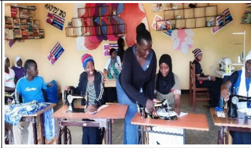
教員がミシンの修理方法を伝えている。