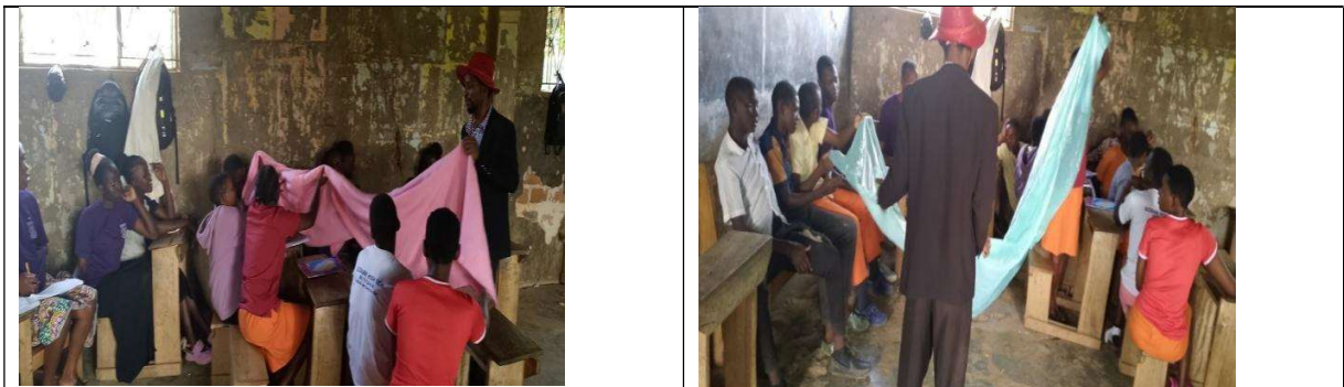
選ばれた生徒が、ロードサイド初等学校のメインホールでプロジェクト・マネージャーとともに教材に触れた。

このプロジェクトは、12歳から18歳までの男女60人と、19歳から40歳までの20人の地域の女性たちに、再利用可能な生理用ナプキンを作るための知識と技術を提供し、彼らの生活を変え、学校生活を持続できるようにすることを目的としている。ミシンの数が不十分なため、まず学校的女子生徒9名と男子生徒3名、地域住民4名を完璧に訓練することにした。プロジェクトを持続、継続させるため、選ばれた生徒たちが他の生徒や他の地域住民を訓練するようにする。