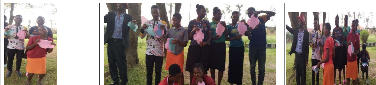
最終的に、皆が布ナプキンの形状に材料を裁断することができた。