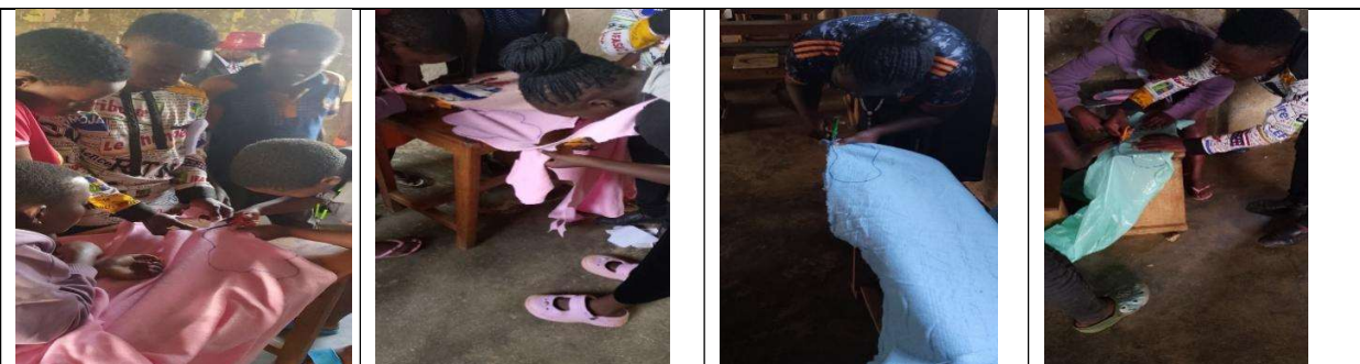
布ナプキンの型紙を作成した後、生徒たちは与えられた材料にそれをトレースする。