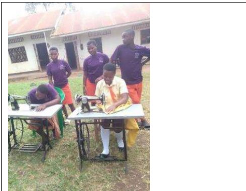
まもなく第 2 四半期が開始する

ロードサイド初等学校の経営陣とコミュニティ全体は、GBN チームからの支援に感謝している。私たちは共にMHM を改善し、あらゆる課題を対処していく。今期の活動は成功し、生徒とコミュニティ全体にとって有益なものとなった。